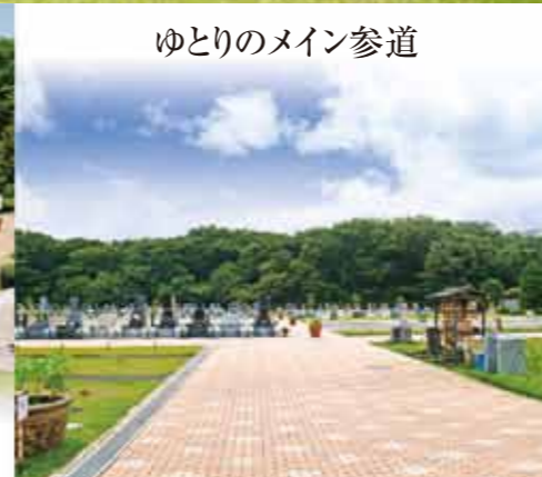
ゆとりのメイン参道