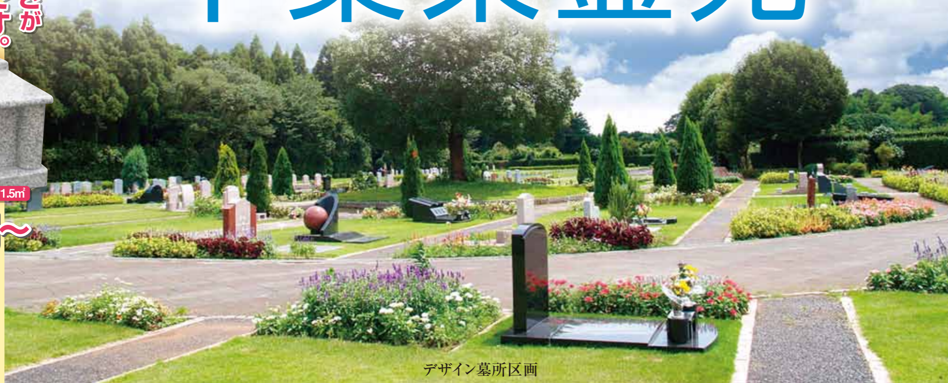
デザイン墓所区画