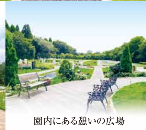
園内にある憩いの広場